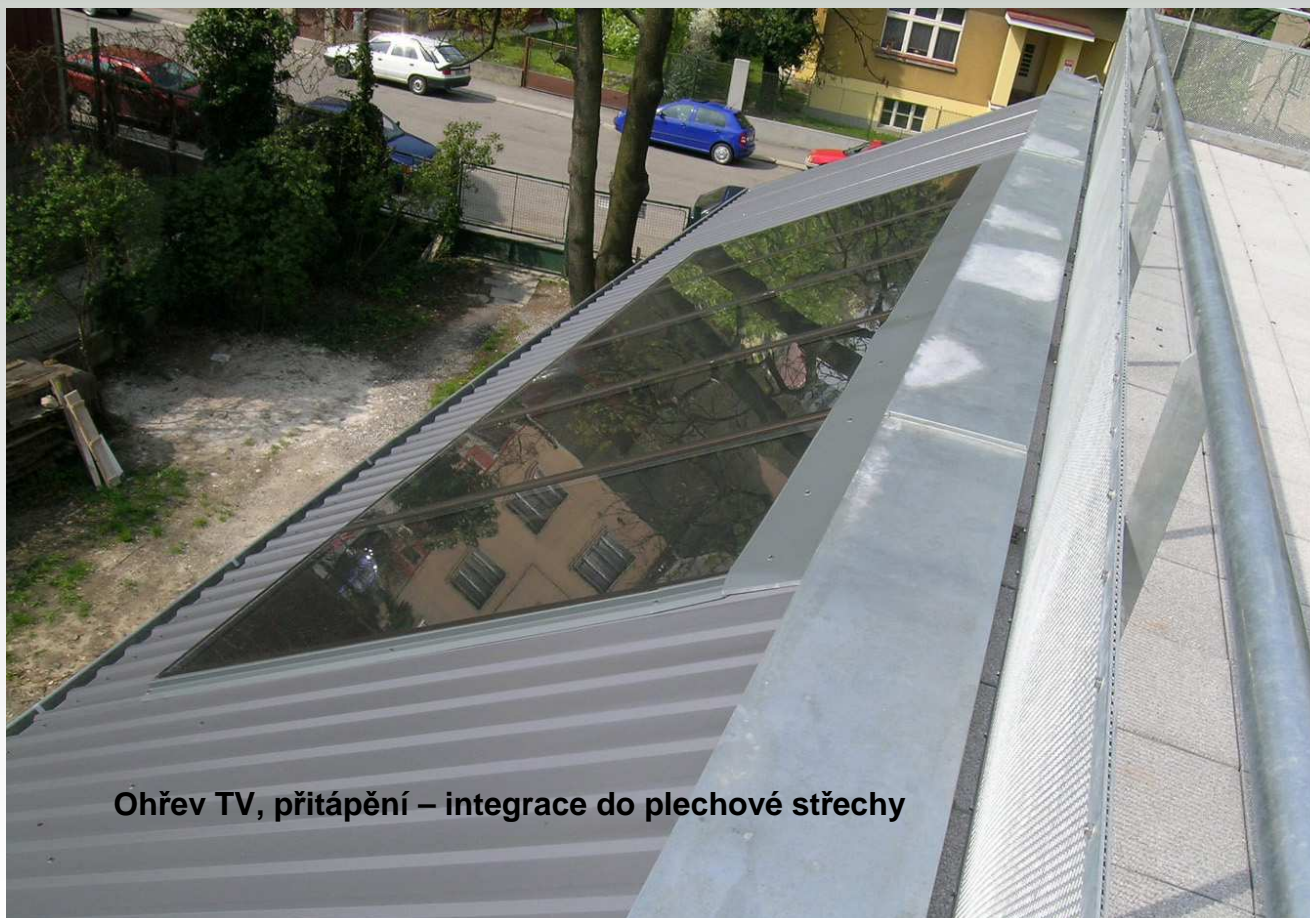
Ohřev TV, přitápění – integrace do plechové střechy